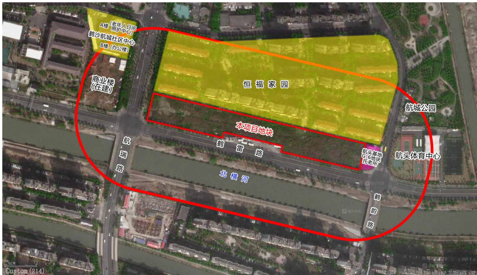
图3.1 项目周边环境情况