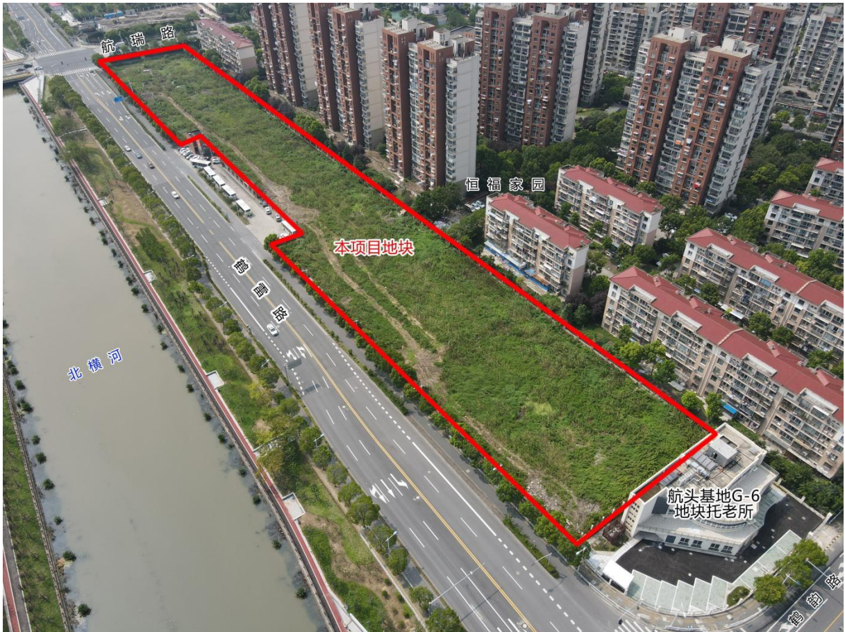
图 1.1 项目地块现状情况图（东南视角）