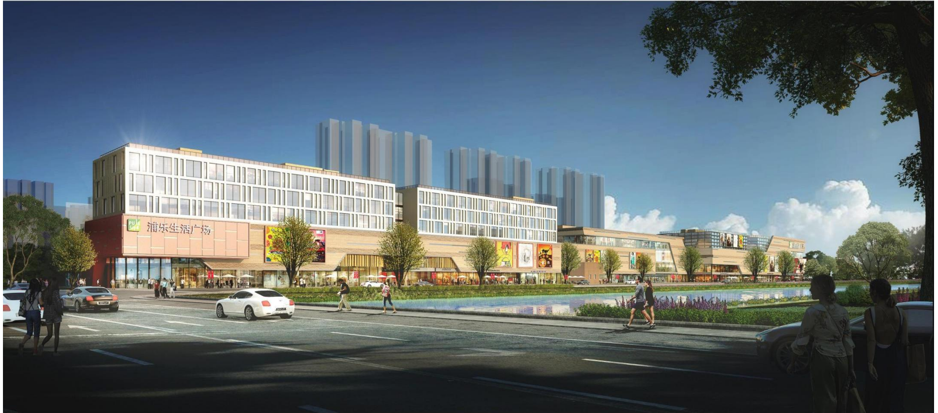
本项目效果图（西南轴侧图）