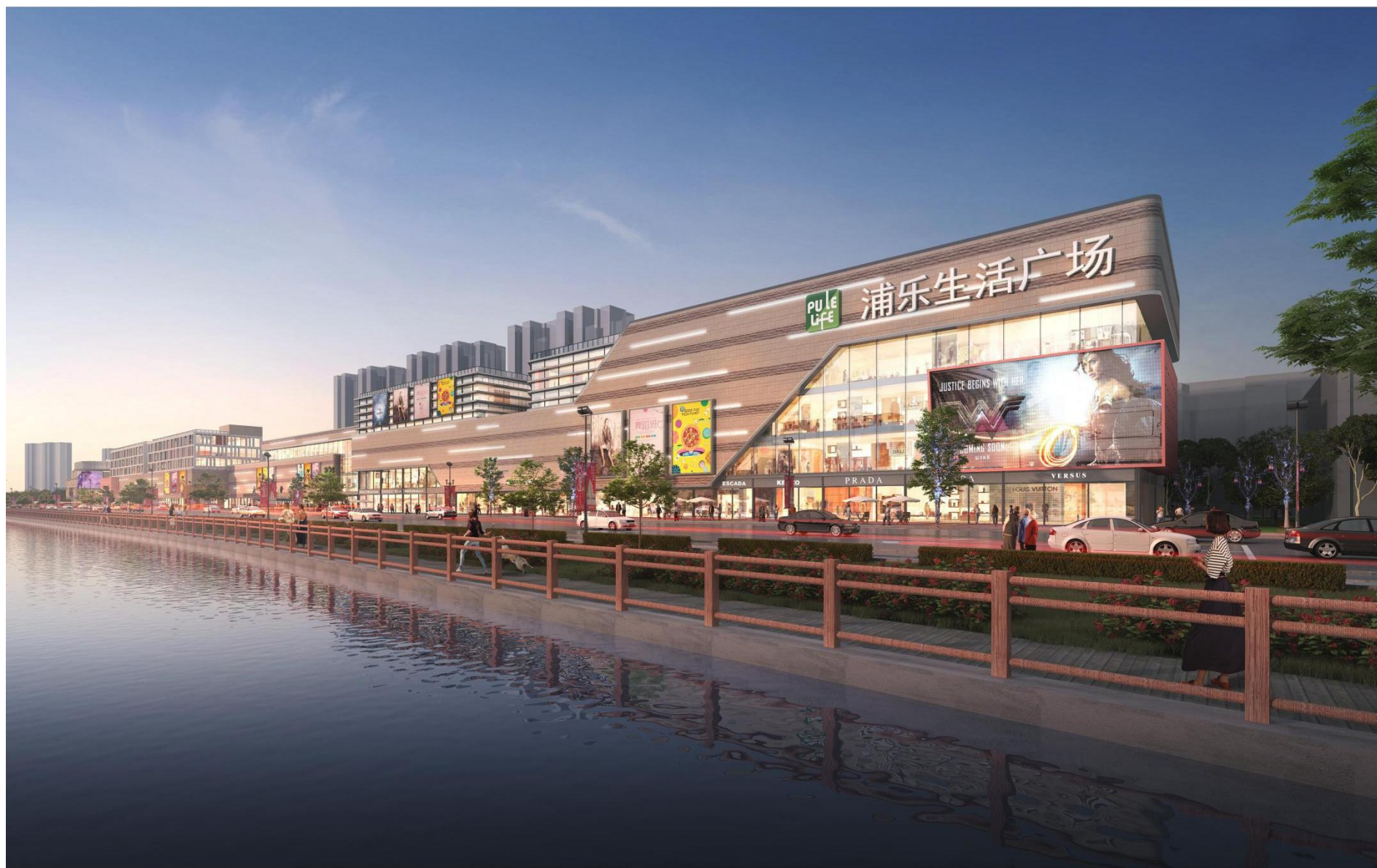
本项目效果图（东南轴侧图）